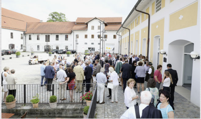
Sommerabend am Alten Speicher

Ebersberg. Volles Haus beim MU-Sommerempfang 2017: rund 500 Gäste aus Wirtschaft, Handwerk und Politik erlebten eine starke Rede von Ministerpräsident Horst Seehofer, mit klaren Aussagen zur Entlastung von Mittelstand und Mittelschicht – im einzigartigen Ambiente des Alten Speicher