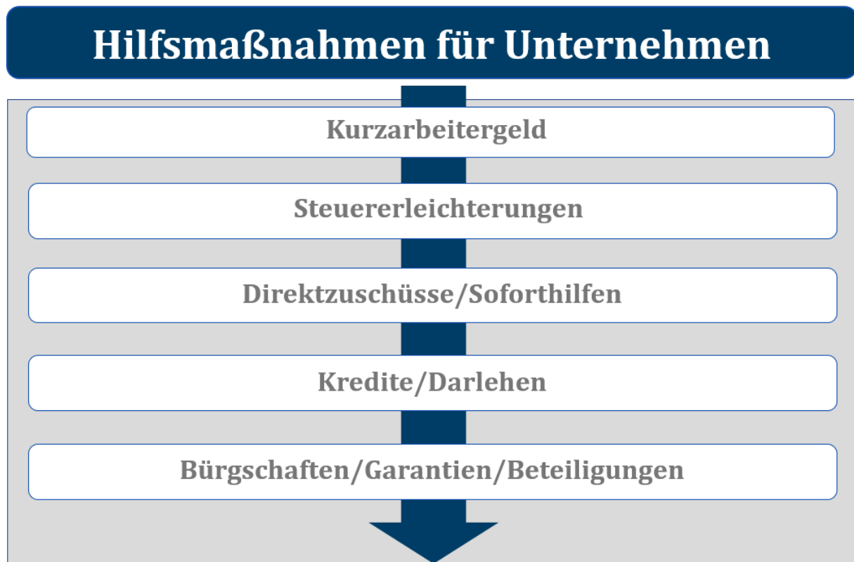
Abbildung 2: Corona-Schutzschirm für die Wirtschaft