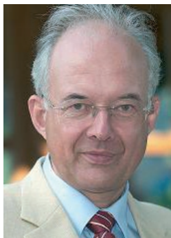
Prof. Dr. Dr. Paul Kirchhof

Unser Denken ist verwirrt. Wer ein gebrauchsfähiges Auto entgegen seiner Planung vorzeitig abwrackt, erhält eine Prämie. Wer sich bereit findet, keine Steuererklärung abzugeben und deshalb entgegen dem Gesetz besteuert zu werden, soll einen Bonus von 300 Euro empfangen. Wir spannen für die einen, die sich im Wirtschaftswettbewerb nicht bewährt haben, einen Rettungsschirm, lassen aber die anderen, die an dieser Fehlentwicklung nicht beteiligt sind, im Regen stehen. Wir lagern gifthaltige, toxische Papiere in einer „Bad Bank“ aus, erhöhen damit das Vermögen der Bank und vermindern das der Steuerzahler. Diese Aktionen sollen bald wieder ein Wirtschaftswachstum fast um jeden Preis erreichen. Selbst wenn